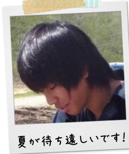
夏が待ち遠しいです!

profile あだ名:かのまた 出身:新得 性格:おしとやか 熱中していること:人間観察 お家造りに対して: すごく難しいけど、やりがいがあります。