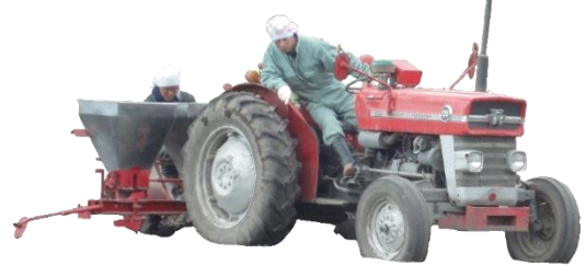
↑毎年活躍のトラクター。

今年も協力業者のみなさまと一緒にアーニスト農園で種まきを行いました! 作業途中で雨が降ったり...とやや不安定なお天気でしたが、 無事にじゃがいも、かぼちゅ、いんげん、えだまめ、きゅうり、なす、とまと... と、たくさんの作物を植えることができました♪