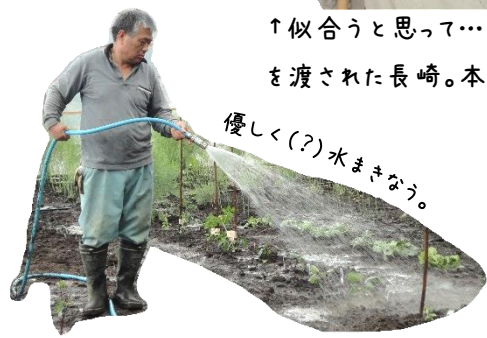
優しく(?)水まきなう。