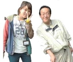
←嬉しそうに持っていますが、これは雑草です