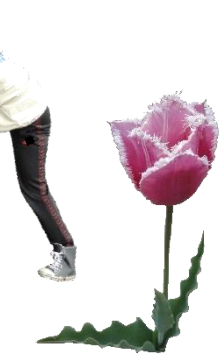
↑農園の端っこだぼつんと咲いていたチューリップ。なぜこんなところに??