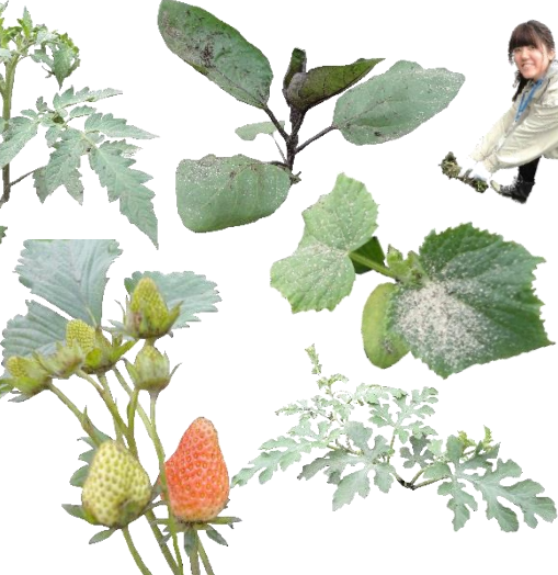
↑たくさん植えた作物たち。なんの野菜かわかりますか?