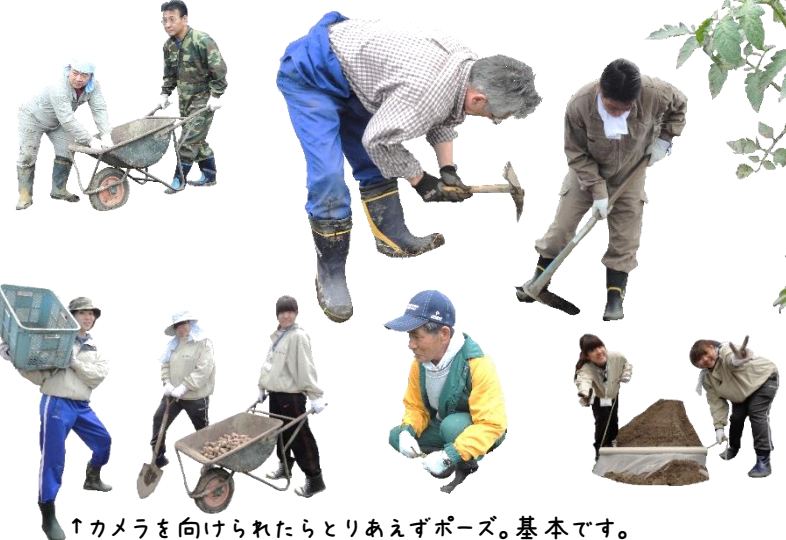
↑カメラを向けられたらとりあえずポーズ。基本です。