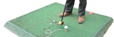
種まきのあとは、日頃の運動不足解消のため、みんなでパークゴルフ♪